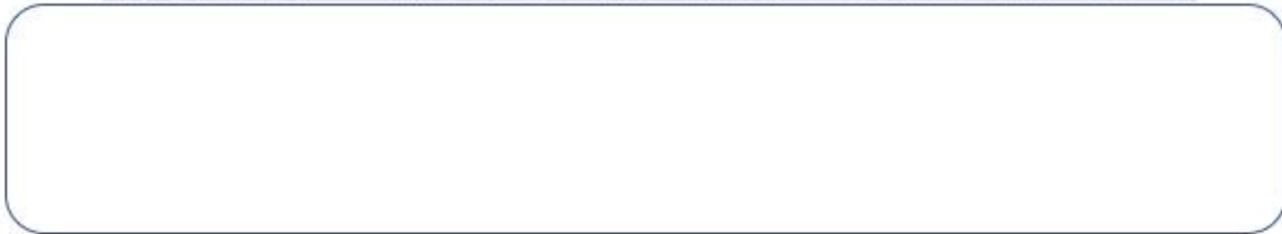
Ilustración 2 Puedes encontrar los objetos ocultos en estas 10 ilustraciones? | Verne EL PAÍS