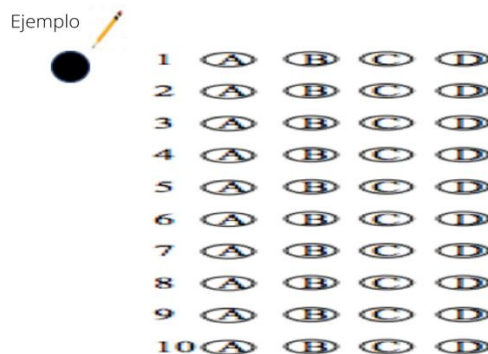
Ilustración 1. Celene Gallego Castrillón